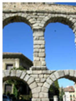
Detalle de la doble arquería