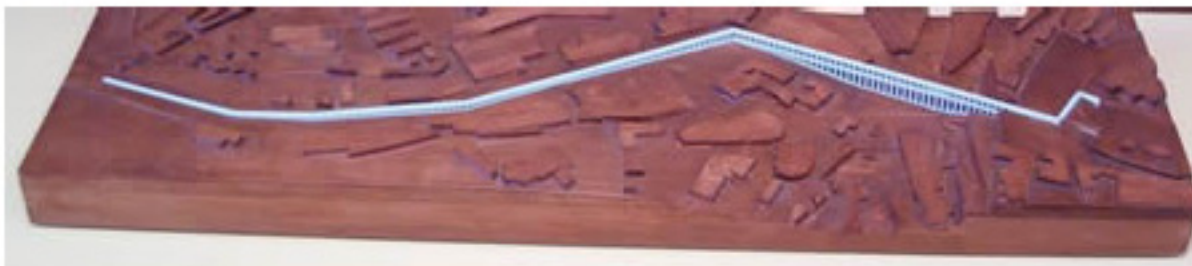
Maqueta del acueducto de Segovia