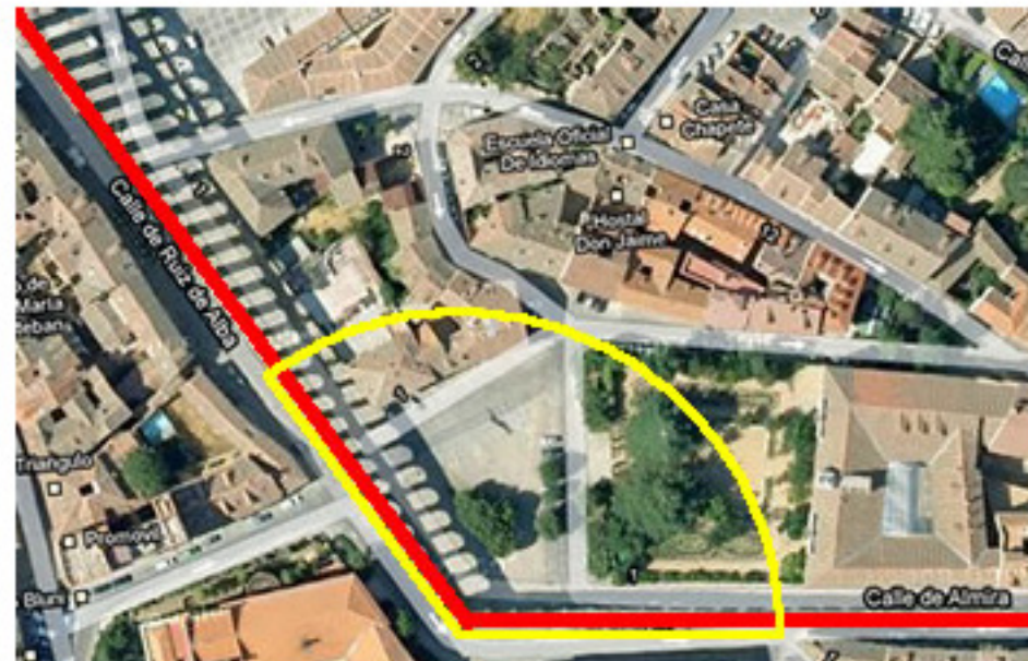
Cambio de dirección en la Plaza de Díaz Sanz