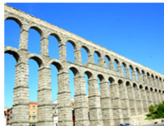
El acueducto a su paso por la Plaza del Azoguejo