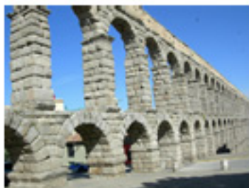
El tramo de doble arquería