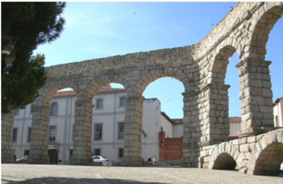
Cambio de dirección en la Plaza de Díaz Sanz