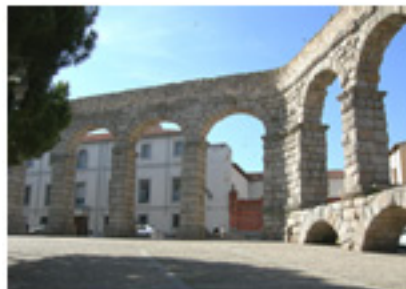
Cambio de dirección en la Plaza de Díaz Sanz

La zona elevada comienza con unos sillares cilíndricos en forma de obelisco, en los que aparece esculpido el acueducto sobre un pergamino sostenido por dos brazos. Con la zona elevada, comienza también el tramo 3, de 141,5 m, que une las dos cisternas, consistente en un canal sobre un muro de 1,4 metros de ancho, y entre 1,4 m y 3,5 m de altura. A partir de este punto, comienza la arquería simple con 6 arcos (tramo 4), 25 arcos (tramo 5) y 44 arcos (tramo 6) hasta llegar al pilar 75, en la Plaza de Díaz Sanz, confluencia de las calle Almira y de la calle Ruiz de Alba, en el que se produce un cambio brusco de dirección y comienza la doble arquería (tramo 7) con 43 arcos. Es el tramo más monumental y grandioso, sobre todo a su paso por la plaza del Azoguejo. Atravesada la muralla, la conducción (tramo 8) continúa sobre un muro y tres arcos, cambia de dirección 90º y prosigue (tramo 9) sobre un muro de 43,7 metros, para soterrarse en el tramo final (tramo 10). En total, 15 km de acueducto con 958 metros de conducción elevada y 162 arcos.